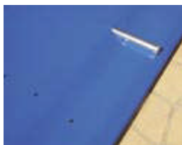
AZUL/BEIGE (Cod. 40939)