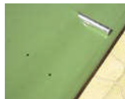
ALMENDRA/BEIGE (Cod. 40941)