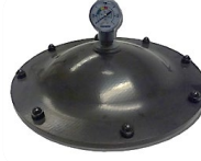
▪ Top lid Ø400 ▪ Tapa superior Ø400