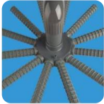
▪ Collector arms ▪ Brazos colectores