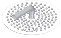
▪ Nozzle plate ▪ Placa crepinas