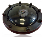
▪ Top lid Ø200 ▪ Tapa superior Ø200