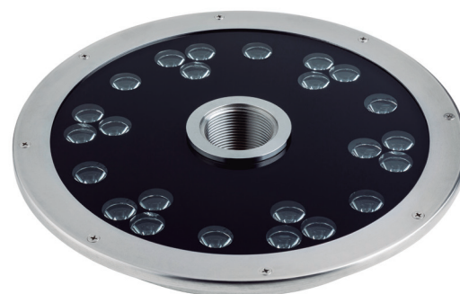
I 1255 Circular Ø300 Circular Ø300