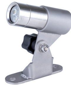
I0882 Directional projector Nano Proyector Nano orientable