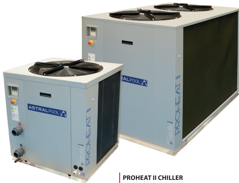
PROHEAT II CHILLER

La nueva PROHEAT II CHILLER es una bomba de calor utilizada para alargar la temporada de baño permitiendo el calentamiento de agua hasta 0°C de aire exterior.