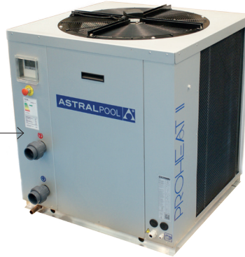
PROHEAT II CHILLER