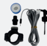
Kit détecteur de débit