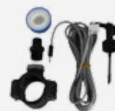
Kit detector de caudal